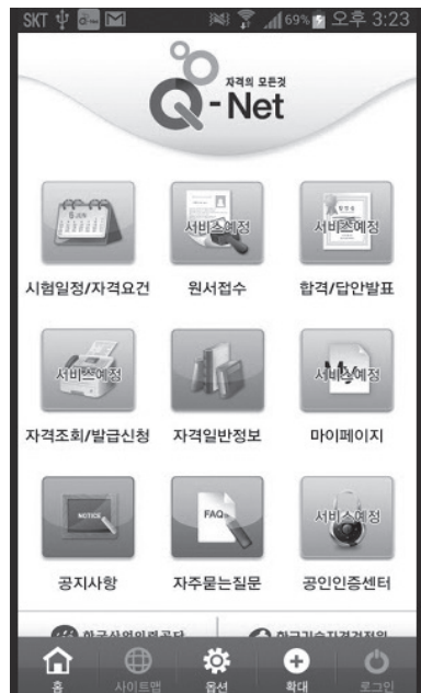
그림 2. 큐넷 모바일 어플리케이션 화면